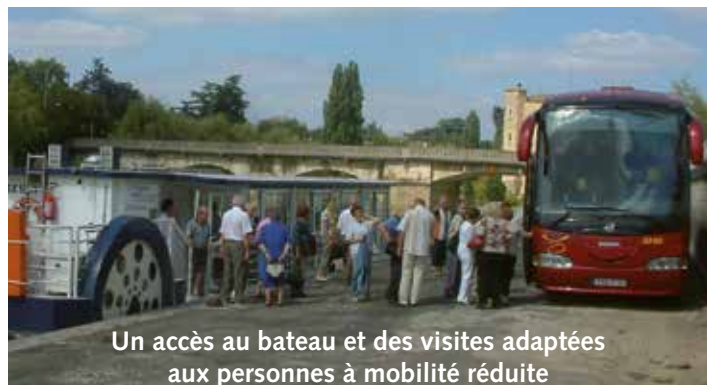
Un accès au bateau et des visites adaptées aux personnes à mobilité réduite

CAPACITÉ D'ACCUEIL : 62 passagers en croisière repas, 75 en croisière promenade