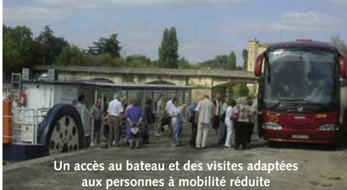
Un accès au bateau et des visites adaptées aux personnes à mobilité réduite

CAPACITÉ D'ACCUEIL : 62 passagers en croisière repas, 75 en croisière promenade